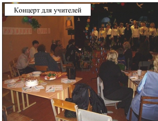
Концерт для учителей