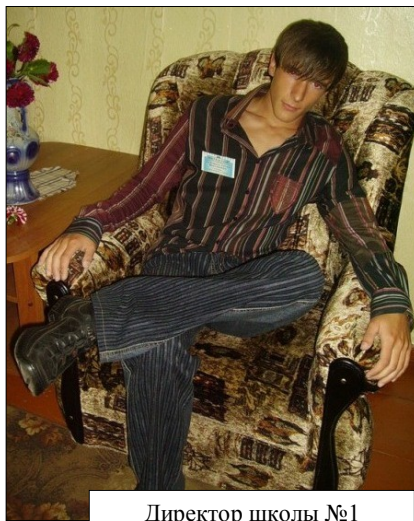
Директор школы №1