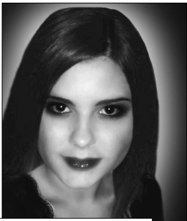
Среди готов бывают и такие красавицы...

Современная goth – субкультура в России очень молода и насчитывает всего лишь 3-5 лет.