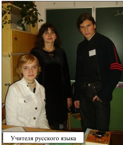
Учителя русского языка