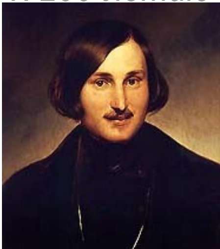
Николай Васильевич Гоголь – слож-

ный и простой, великий и доступный, романтик и реалист, прозаик и поэт. Да, его творчество абсолютно противоречиво в разные периоды жизни писателя.