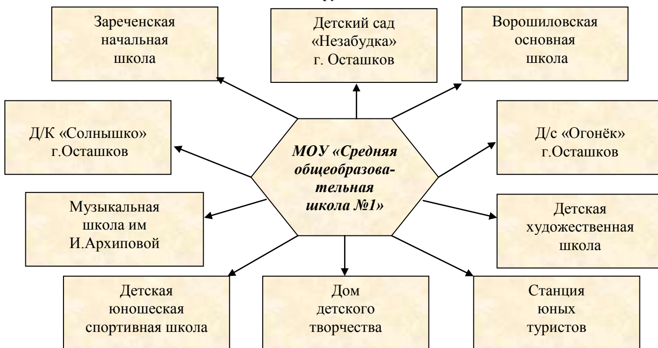
Мероприятия по выполнению целей и задач проекта «Базовая школа»