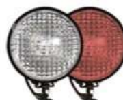
фары на СИМ